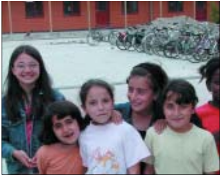
Kinderen van asielzoekers zijn net als alle andere kinderen in Nederland leerplichtig.Vaak leren zij op school binnen de kortste keren Nederlands.