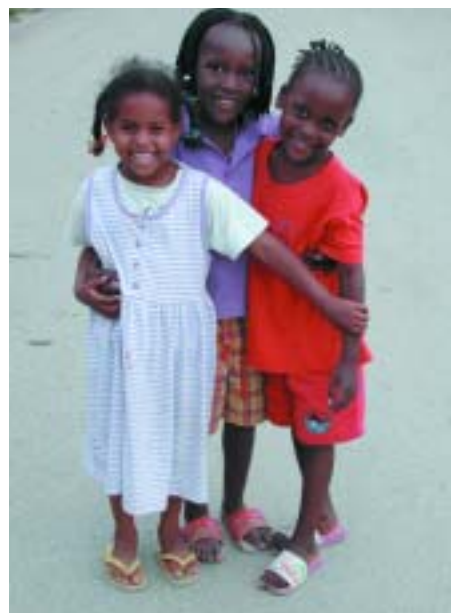
Kinderen van asielzoekers zijn net als alle andere kinderen in Nederland leerplichtig. Vaak leren zij op school binnen de kortste keren Nederlands.

Dat laatste drong ook tot de politiek door. "De afgelopen jaren zie je dan ook dat er besluiten zijn genomen waardoor de bewoners steeds meer zelf móchten als zelf móesten gaan doen. Het begon met 'zelfwerkzaamheid': voor één gulden per uur konden asielzoekers in het centrum gaan meehelpen met het schoonhouden van de gemeenschappelijke ruimtes, met snoeiwerk en met klein onderhoud. Dit leverde niet alleen een nuttige tijdsbesteding en wat extra zakgeld voor de bewoners op, maar ook financiële besparingen voor de centra. Het aanbod taalles en 'maatschappij oriëntatie' (wat is een strippenkaart, hoe zit de Nederlandse gezondheidszorg in elkaar, waarom mag je bij een Nederlander niet zomaar koekjes pakken als het schaalpje op tafel staat) werd in die tijd geprofessionaliseerd en uitgebreid. Naast de reguliere lessen, die op verschillende taalniveaus gegeven worden door (vaak erg professionele) vrijwillige docenten, hebben asielzoekerscentra inmiddels een lokaal waar de bewoners met computerprogramma's Nederlands kunnen leren. Ze bepalen dan hun eigen lestempo. Dat is goed, want er zitten zowel analfabeten als professoren in de centra en hoewel sommige bewoners zich door traumatische ervaringen absoluut niet kunnen concentreren op